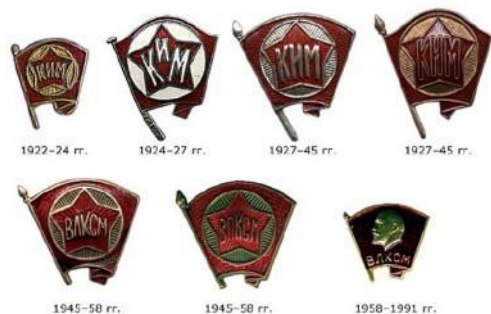
Первые нагрудные значки комсомола появились в 1922 году

29 октября - 4 ноября 1918 года прошёл I Всероссийский съезд союзов рабочей и крестьянской молодёжи, на котором было провозглашено создание РКСМ (Российский коммунистический союз молодёжи)